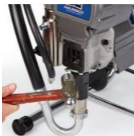
Desserrer l'écrou de blocage