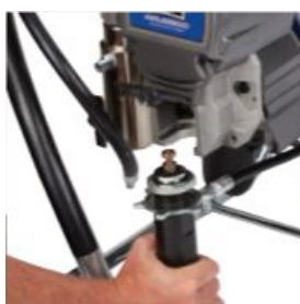
Soulever le capot noir puis Retirer le bas de pompe